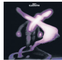
GIFT ★★★★☆ ILLUMINATOR POP-SHOEGAZE CAPTURED TRACKS