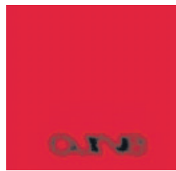
MURA MASA ★★★★☆ CURVE 1 POP-CLUB POND RECORDINGS

★★★★ obra mestra / ★★★★★ molt bona / ★★★ bona / ★★★★★ regular / ★★★★★ dolenta