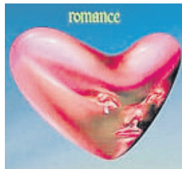
FONTAINES D.C. ★★★★☆ ROMANCE POP-ROCK XL RECORDINGS

Amb l'anterior Skinty fia , la formació liderada per Grián Chatten ja havia aconse-